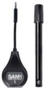
SAM-1 with smart pH- temperature sensor